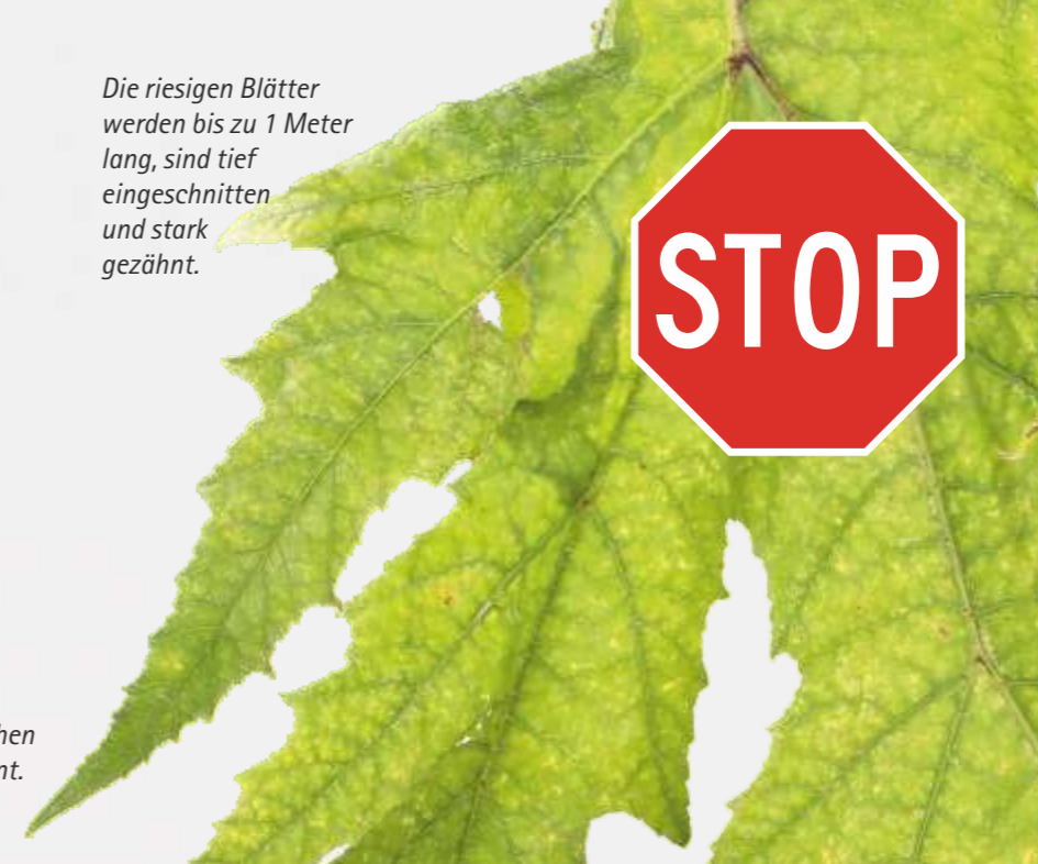
Die riesigen Blätter werden bis zu 1 Meter lang, sind tief eingeschnitten und stark gezähnt.

Die abgeflachten Früchte bilden ovale Samen mit fünf Rippen aus.