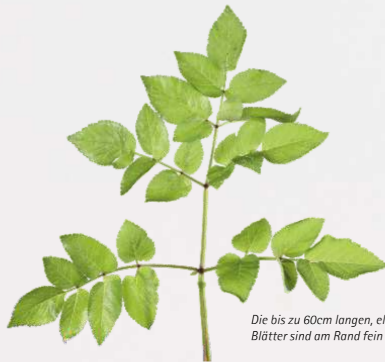
Die bis zu 60cm langen, elliptischen Blätter sind am Rand fein gezähnt.

Die Früchte mit ovalen, dünn gerippten Samen sind unbehaart.