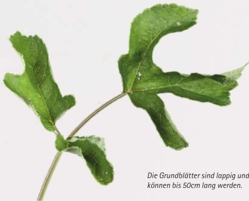
Die Grundblätter sind lappig und können bis 50cm lang werden.