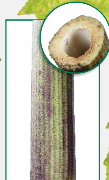
Der hohle Stängel ist im unteren Bereich oft rötlich gefleckt.

Der Saft dieser Pflanze führt unter UV-Einstrahlung zu überaus schmerzhaften Verbrennungen!